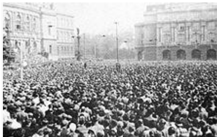
Masová demonstrace před Rudolfinem v Praze (tehdejším sídlem Poslanecké sněmovny) 22. září 1938 za obranu Československa

3. srpna 1938 zahájil britský lord Walter Runciman pražskou misi, jejímž cílem bylo urovnat spory mezi československou vládou a německou menšinou, reprezentovanou SdP. Avšak i tato mise skončila bezvýsledně, protože SdP stále odmítala jakýkoliv kompromis. Počátkem září byl československou vládou schválen Návrh o postupu jednání ohledně úpravy národnostních otázek , který vznikl na základě přímých rozhovorů vyjednavců SdP, a který vycházel v zásadě vstříc většině požadavků Karlovarského programu. Tento plán přijala jak Runcimanova mise, tak část z umírněnějších předáků SdP, kteří uznávali, že plní většinu Karlovarského programu. Po Henleinových dalších jednáních s Hitlerem ale SdP 7. září vyprovokovala incident v Moravské Ostravě, jehož vedení SdP využilo jako záminku k úplnému a konečnému přerušení jednání s prezidentem a vládou. Dne 12. září 1938 na sjezdu NSDAP v Norimberku Hitler nevybíravě zaútočil proti Československu a proti prezidentu Benešovi, což podnítilo sudetské Němce k vyvolání puče. Nepokoje byly za dva dny Československou armádou i četnictvem potlačeny a vedoucí činitelé SdP uprchli do Německa.