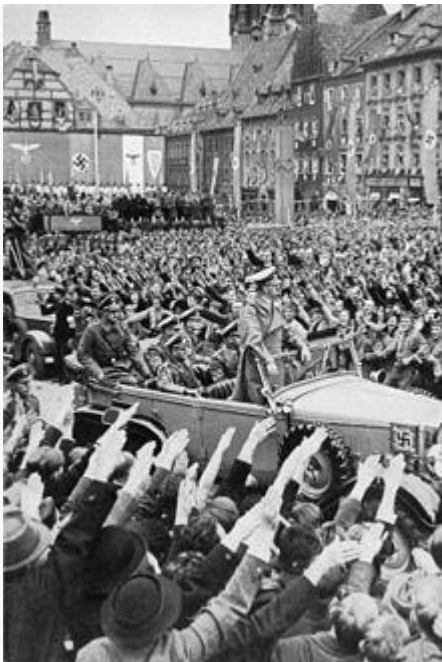
Sudetští Němci v Chebu vítají Adolfa Hitlera