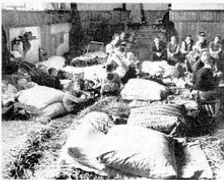
Čeští uprchlíci z pohraničí

Dohoda se může vykládat jinak z českého (resp. československého) či britského nebo německého pohledu. Především česká strana soudí, že dohoda je od samého začátku, tedy "ab initio", neplatná, německá strana uvádí, že Edvard Beneš neopouštěl Československo jako prezident, ale jako soukromá osoba a jistá mezinárodní právní platnost československé vlády existovala, jelikož ve válečném stavu se Československo či později Česko-Slovensko nemohlo nalézat dřív než po vypuknutí války. Společnost národů se měla právním stavem okupací okleštěné ČSR a následným vznikem protektorátu zabývat v září 1939, ale k tomuto jednání již vzhledem k událostem (útok na Polsko) nedošlo.