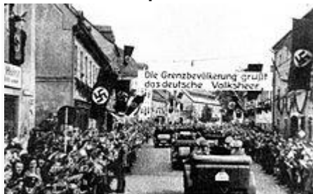
Příjezd německých vojsk do Sudet

Odstoupením pohraničních území Německu, Polsku a Maďarsku byla pozice Československé republiky značně oslabena. Země ztratila podstatnou část svého území, což znamenalo přetrhání dlouholetých vazeb, hlavně v ekonomice a dopravě. Musela být přeorganizována železniční síť, neboť některé do té doby hlavní železniční trati (přes Českou Třebovou , Český Těšín , či Košice ) se nyní staly peážními , tedy vedenými přes cizí území. Byly vypracovány projekty nových tratí a stejně byl upraven i projekt první československé dálnice. Pátevní spoje nyní procházely přes Havlíčkův Brod, Vsetín, či Martin. Spojení s Podkarpatskou Rusí, které bylo vybudováno po vzniku republiky, bylo nyní na území Maďarska a bylo jej nutné opět vystavět.