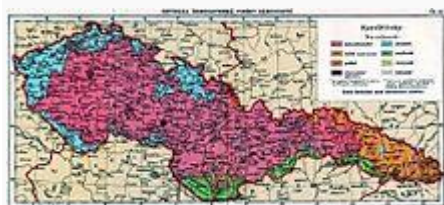
Národnosti na území českých zemí podle sčítání lidu v roce 1930

19. září vyzvaly vlády Anglie a Francie československou vládu, aby odstoupila pohraniční oblasti s více než 50% německého obyvatelstva (podle posledního rakouského sčítání lidu v roce 1910, zjišťujícího národnost podle tzv. obcovací řeči) Německu. Československá vláda však tento požadavek odmítla.