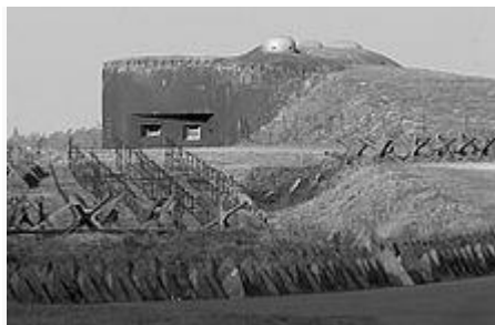
Československé pohraniční opevnění

května Hitler vydal podrobné válečné směrnice k útoku na Československo. Dne 30. června 1938 bylo čs. vládou schváleno znění tzv. národnostního statutu, který byl velkým ústupkem vůči sudetským Němcům, avšak i tento dokument byl SdP v duchu „doporučení“ Adolfa Hitlera odmítnut.