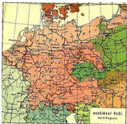
Národnosti na území českých zemí podle sčítání lidu v roce 1910